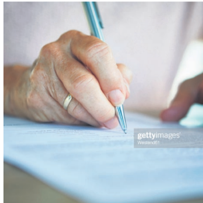
Testamente unterliegen Formvorschriften, damit sie gültig sind.

Die Ungültigkeitsklage kann von jedermann erhoben werden, der als Erbe oder Bedachter ein Interesse daran hat, dass die letztwillige Verfügung für ungültig erklärt wird. Zur Klage ermächtigt ist also nur, wer entweder als Erbe